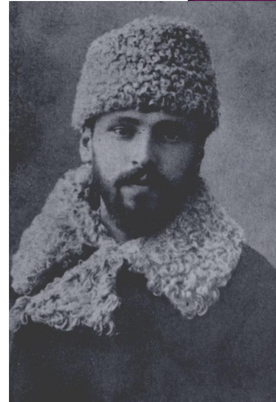
Вінниця, 1890 р.