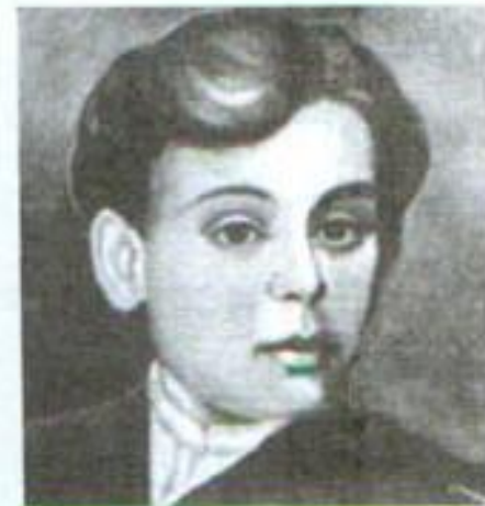
М. Коцюбинський. Фото поч. 70-х років

Дитинство та юність майбутнього письменника минули в містечках і селах Поділля, куди переводили батька по службі. Коли Коцюбинські переїхали у містечко Бар, то Михайла віддали до початкової школи (1875 – 1876), де він був дуже старанним учнем. Дитинство Михайла Коцюбинського минало в теплій, дружній сімейній обстановці, хоч інколи в скрутних матеріальних умовах. Кволий, худенький хлопчик з блідим матовим лицем був улюбленцем родини, особливо матері Ликери Максимівни, - жінки доброї, люблячої, із складною і глибокою душею. Їй було властиве тонке розуміння літератури та мистецтва. Під впливом матері у хлопчика рано розвинувся інтерес до читання.