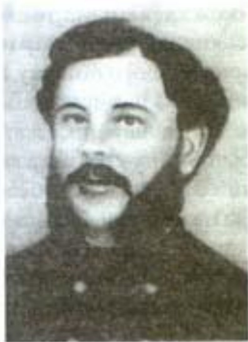
Батьки Михайла Коцюбинського: Михайло Матвійович та Гликерія Максимівна