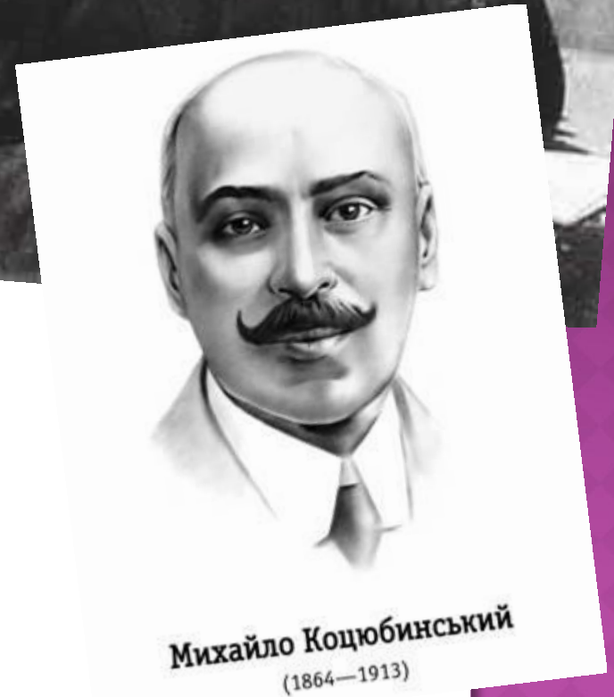
Михайло Коцюбинський (1864—1913)