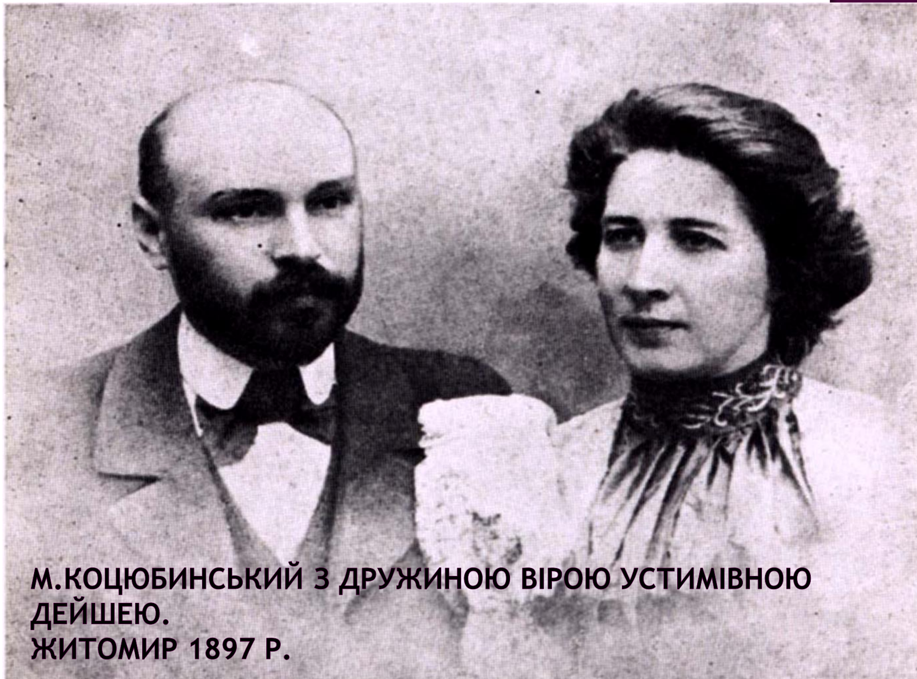
М. КОЦЮБИНСЬКИЙ З ДРУЖИНОЮ ВІРОЮ УСТИМІВНОЮ ДЕЙШЕЮ. ЖИТОМИР 1897 Р.